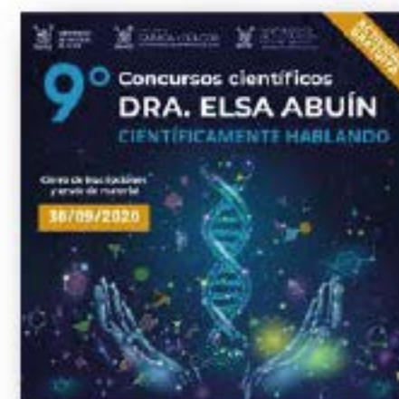
Comunicación del Conocimiento en Comunidades Escolares