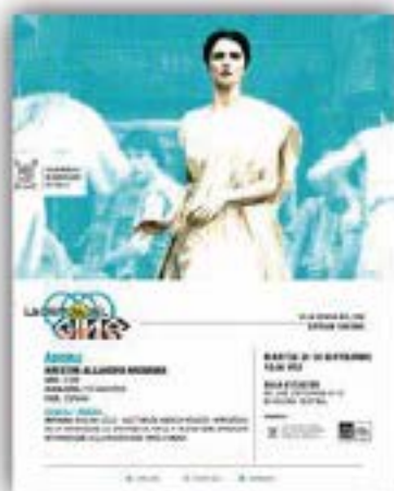
Ciencia en el Cine