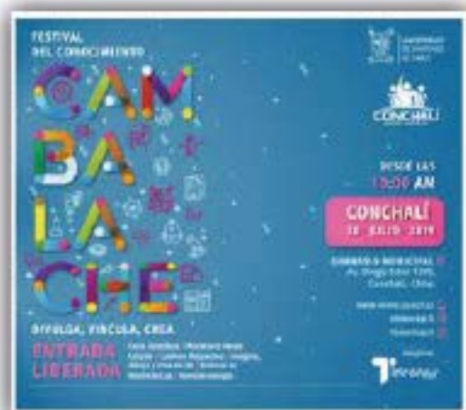
Festival del Conocimiento Cambalache