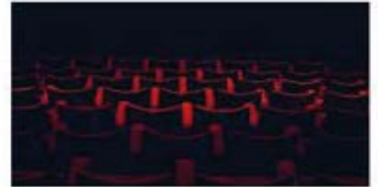
Conversatorio "Hablemos sobre Constitución y Derecho a la Cultura"