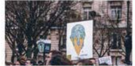
Charla "Innovando desde la Academia para combatir el Cambio Climático" #UsachAccionaElCambio