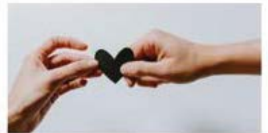
Espacio de reflexión en tiempos de pandemia